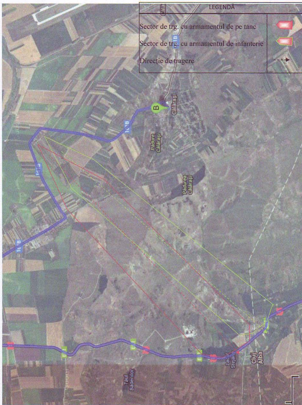
Harta cu sectoarele de siguranță în poligonul Automatizat Bogata